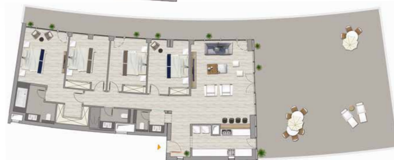
Plan Type S+4 - Vue Mer Salon + 1 Suite + 3 Chambres Surface totale : 311.9 m 2