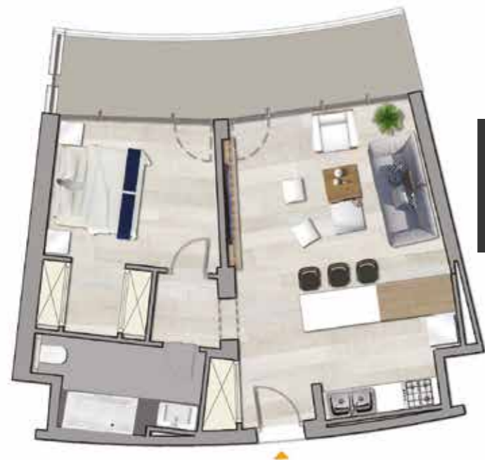
Plan Type S+1 - Vue Marina Salon + 1 Chambre Surface totale : 92.2 m 2

* d'autres plans d'appartements disponibles à la demande