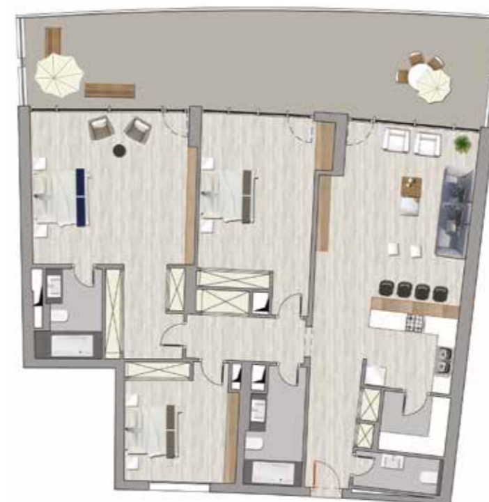
Plan Type S+3 - Vue Marina Salon + 1 Suite + 2 Chambres Surface totale : 287.3 m 2