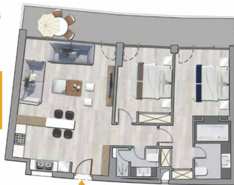
Plan Type S+2 - Vue Mer Salon + 1 Suite + 1 Chambre Surface : 154.4 m 2